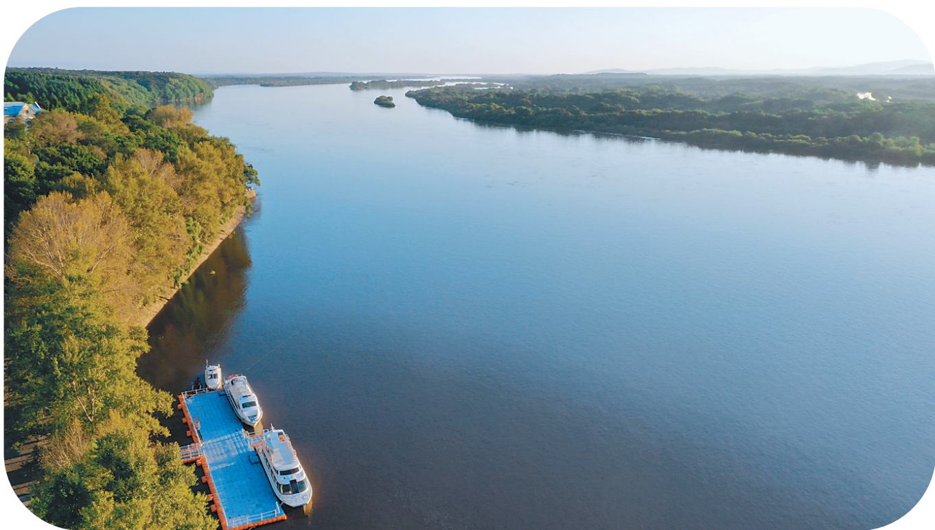
乌苏里江边的虎头镇,湿地遍布,风光秀美,虎头镇扼守乌苏里江天堑,物产丰富。

虎头镇,坐落在虎林县城东66公里的乌苏里江畔,一个被森林、湿地和江水围裹着的边境小镇。