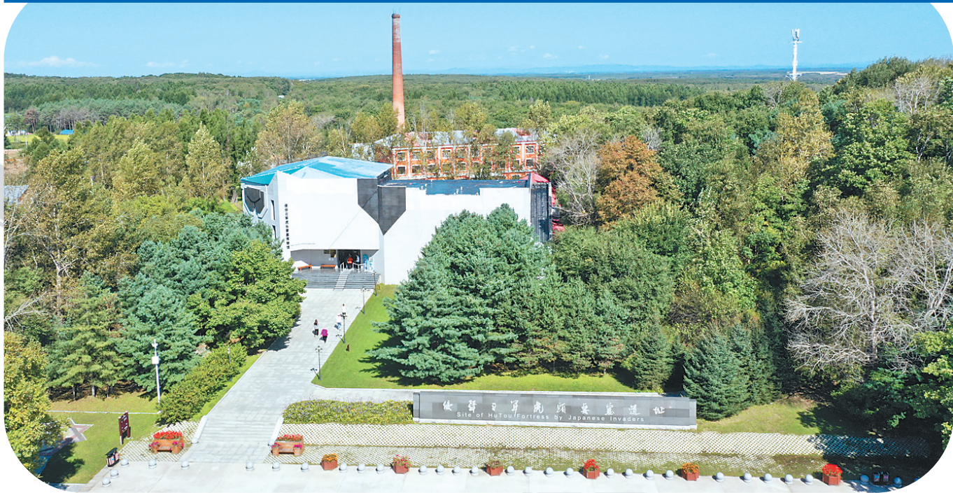
侵华日军虎头要塞遗址。

深秋时节,报道组驱车从331国道进入虎林市,探访坐落于乌苏里江畔虎头镇的侵华日军虎头要塞遗址,与东宁要塞一样,这里也是“二战”终结地。