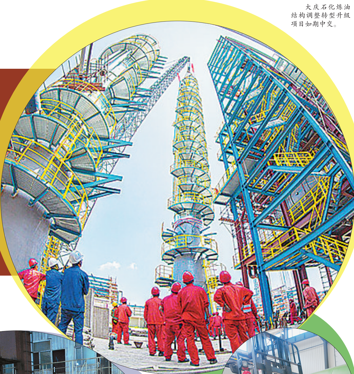
大庆石化炼油结构调整转型升级项目如期中交。

慎终如始,善作善成。当前正是经济指标的冲刺期、各项任务的收官期,也是干部作风的大考期。日前,记者走进龙凤区,实地体验该区举全区之力推动“油头化尾”产业裂变扩能升级的信心决心,探寻从工业立区迈向工业强区的真招实招和效果成果。