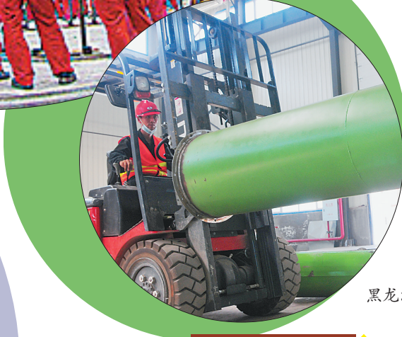
黑龙江中实再生资源开发有限公司。