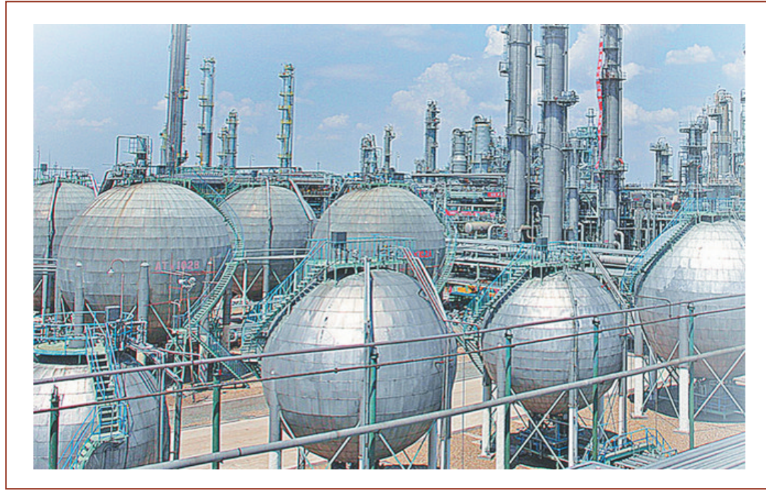
现代化的乙烯装置区。

日前,大庆市制定出台《大庆市“三百行动”百日攻坚战工作方案》,龙凤区同全市同频共振、步调一致,提出利用100天时间,紧盯黄金期、冲刺期、窗口期,打赢打好项目建设提速、存量企业挖潜、招商引资提效“三大攻坚战”,为全市乃至全省经济增长作出“龙凤贡献”。