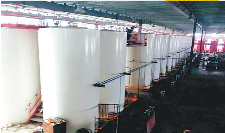
大庆市润昌润滑油有限公司。