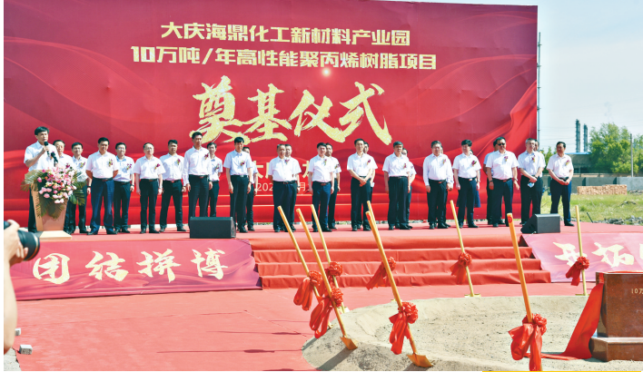
大庆海鼎化工新材料产业园奠基。

积极盘活园区闲置资产,腾笼换鸟、培育企业。采取弹性出让、先租后让等办法,累计整合天马公司、昊角建材、华西尔木业、云辉科技、赞峰科技、金土地、瑞盛科技、禹泰保温、韵舟建材、孵化器 etc 10家企业闲置厂房27栋9万平方米、办公楼10个3.3万平方米,为企业轻资产“拎包入住”、缩短企业进驻周期提供全方位保障。