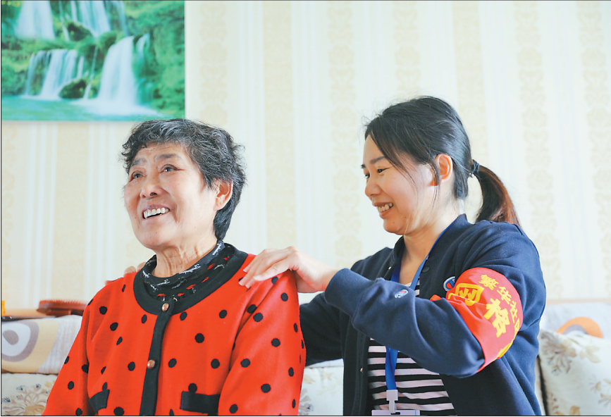
社区网格员看望辖区内老人。

联系卡、民情日志、工作证,切实提升网格员的形象。同时汇编了《同江市网格员工作手册》,包括网格员基本工作职责、工作要求、工作流程和办理民生事项所需条件、要件及服务部门常用电话等,规范了各类信息采集标准,明确了社情民意收集工作范围,确保网格员在服务过程中不走形、不变样。