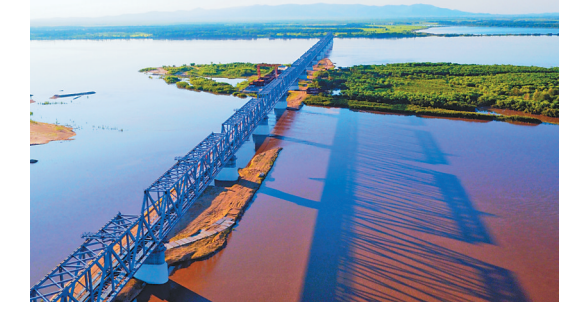
中俄同江铁路大桥。