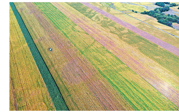
331国道呼玛段,深秋的田野宛如五色花海。