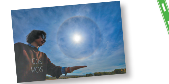
在漠河,遭遇日晕景观。