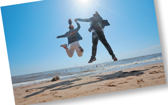
一对情侣,在兴凯湖边跳起拍照。

有人说,畅游“醉美331”是一次对心灵的洗礼,是一次对自然的膜拜,更是人生应该经历的一次极致旅行。从百鸟云集的兴凯湖到三江平原的万亩稻浪,从温润绚丽的玛瑙到水中活化石鲟鳇鱼,掠过森林湖泊,俯瞰花田林海,黑龙江这片神奇的土地已经聚集了世界的目光,“醉美龙江331”等你来。