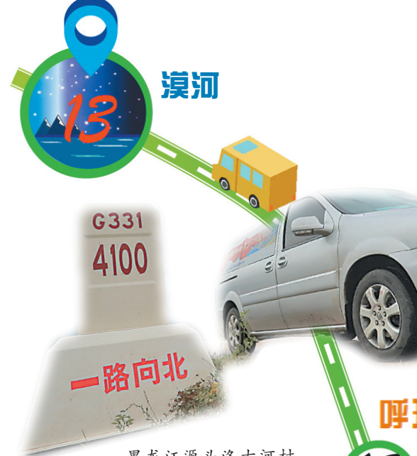
黑龙江源头洛古河村旁,一路向北的采访,到此暂时画上句号。