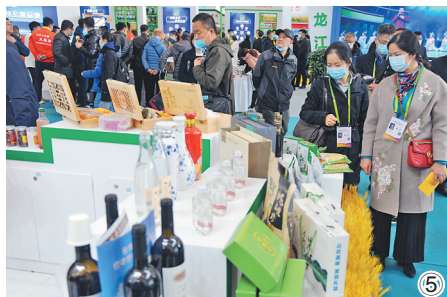
①②③④⑤ 绿博会七台河展台。