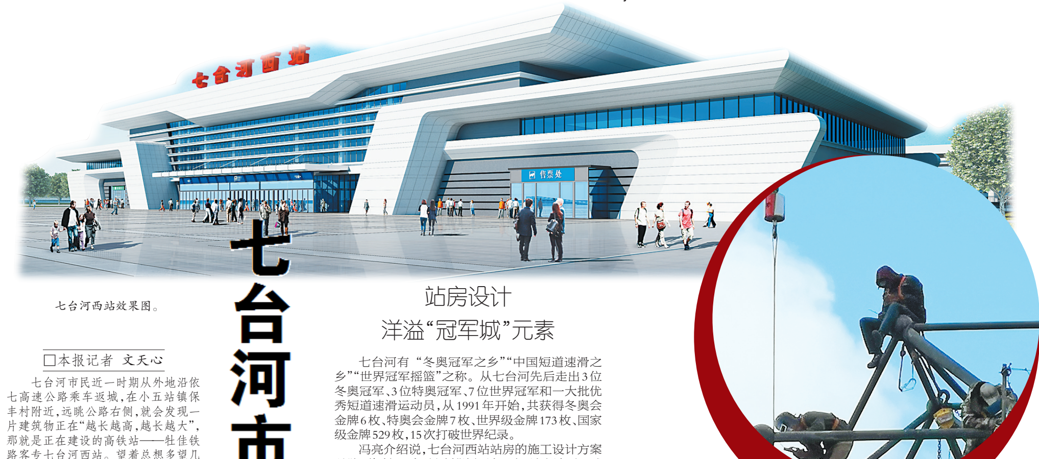
七台河西站效果图。