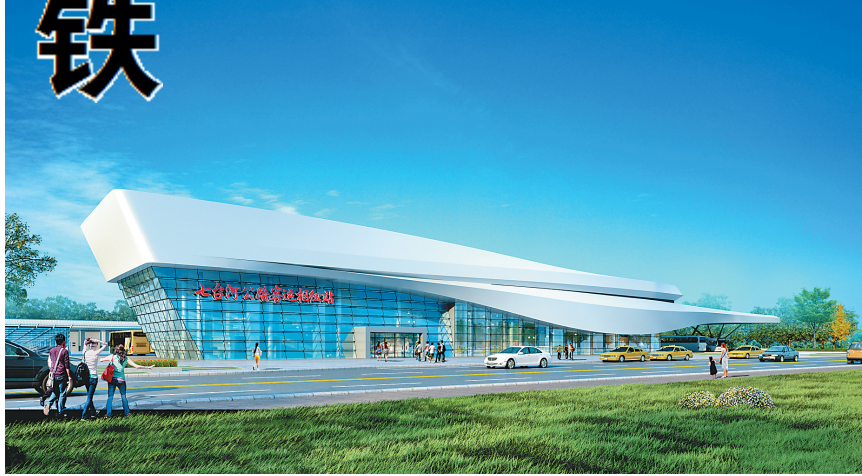
客运枢纽站效果图。

可以想见,洋溢“冠军城”元素的七台河西站在不久的将来定是当地的新地标,“冬奥冠军之乡”美名将随着高铁的开通传播四方。