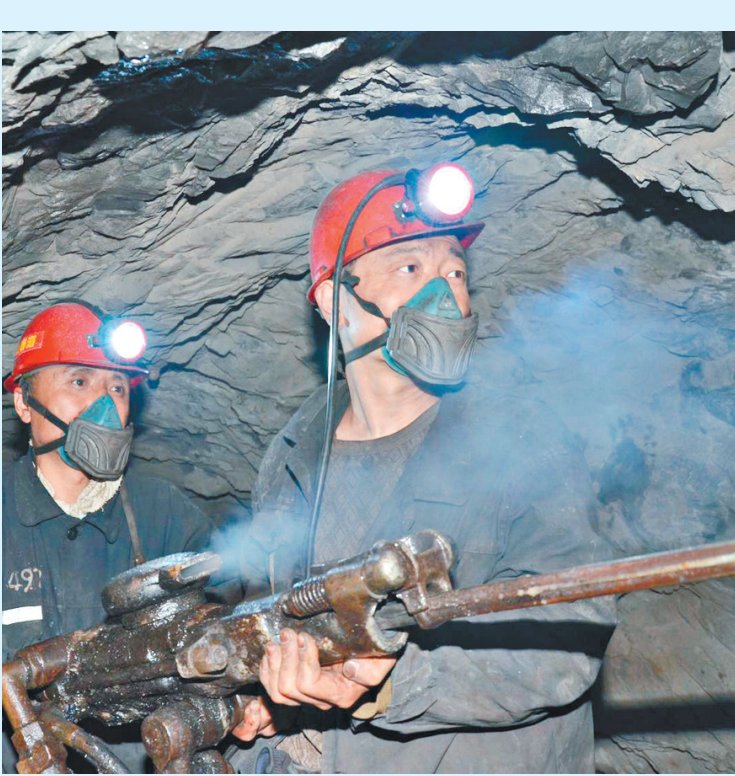
七台河矿业公司全力确保矿铁路运输正常运行。

无论是发展环境还是政策,我省民营经济发展活力已经被全面激活。2020年上半年,全省市场主体达到254.97万户,同比增长9.1%。与此同时,我省民营企业的经营效益也在大幅提升,今年10月,2020黑龙江省民营企业100强发布,榜单显示:黑龙江民营企业100强实现营业收入为2734.8亿元,较上年增长0.54%;实现净利润121.59亿元,较上年增长7.01%。