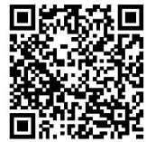
道里区老旧小区改造服务微信群

题。公布道里区老旧小区改造服务微信群二维码,居民和本项目实施老旧小区改造的监理单位、施工单位、指挥部工作人员在线交流,足不出户表达自己的意见和建议。 第二项:强化质量巡查。成立5个质量巡查组,对当前老旧小区改造工程各主体、配套标段工程质量进行一次地毯式的“回头看”,建立台账,实行倒排销号,确保问题有效整改;由区纪委监委、区各相关部门组成督导组,对质量问题进行独立督导。 第三项:强化质量督导,上限处罚。约谈会后,各施工单位、监理单位在老旧小区改造项目中如出现使用不合格材料、未按设计施工等问题,给予上限处罚。