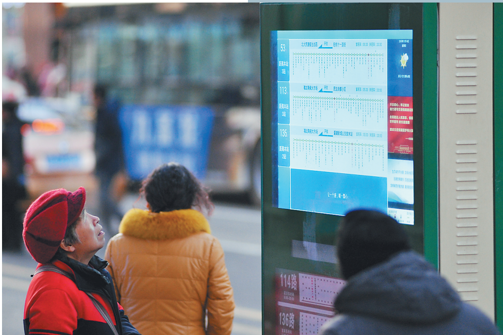
电子站牌让百姓出行更便捷。