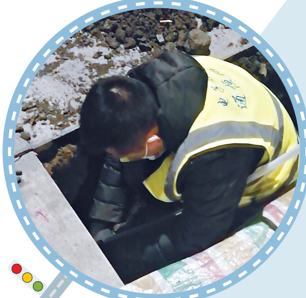
工作人员连夜抢修故障电子站牌。