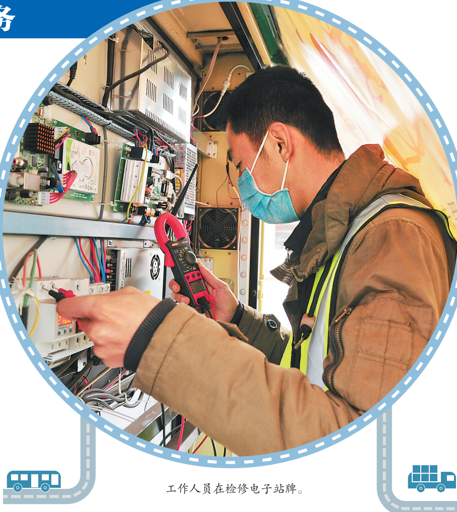
工作人员在检修电子站牌。

让这名网友惊喜的背后,是哈市交通运输局主动作为、及时解决百姓诉求的决心。为广泛关注意意,及时整改交通各行业的问题,切实提高群众出行感受,该局于2019年末设立“满意出行快速反应微信工作群”,建立健全快速反应工作机制,上下联动、及时反馈、立行立改。截止目前,该局第一时间关注各种渠道人民提出的问题和意见234条,做到件件有着落,事事有回音。