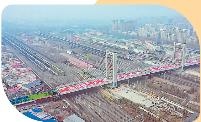
哈西大街打通工程转体斜拉桥成功转体对接。