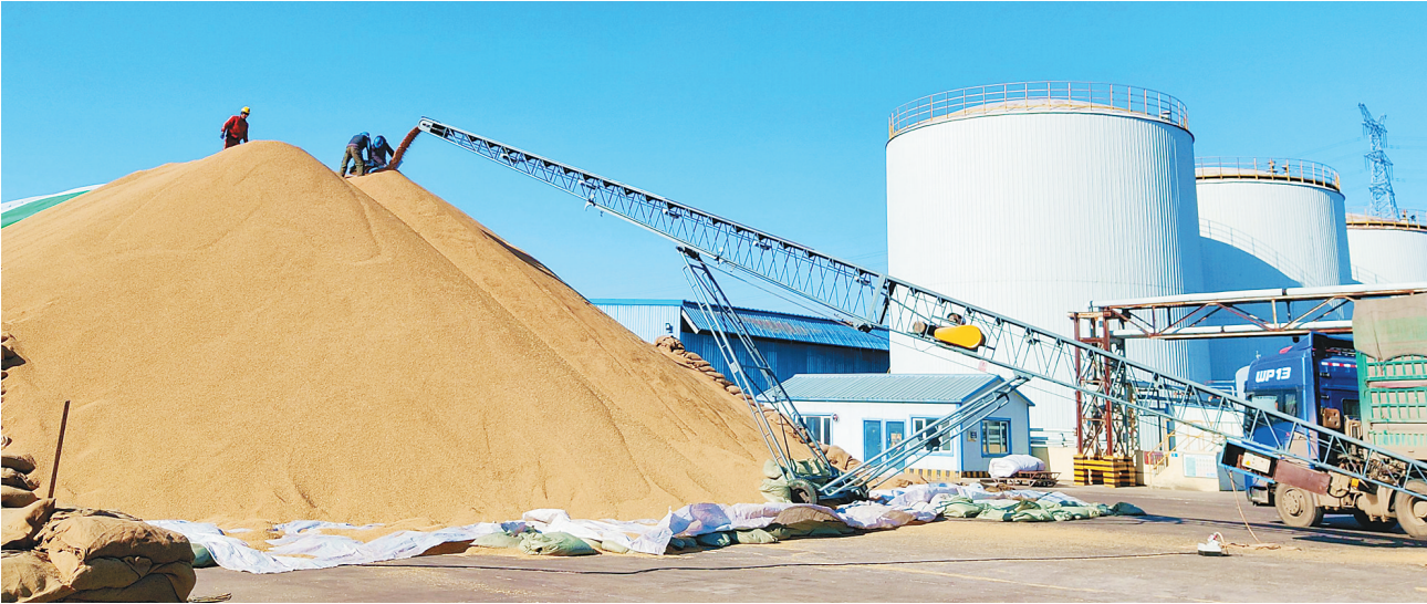
益海(佳木斯)粮油工业有限公司收粮现场。