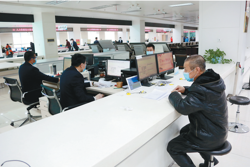
办事群众在行政服务中心大厅等候办理业务。