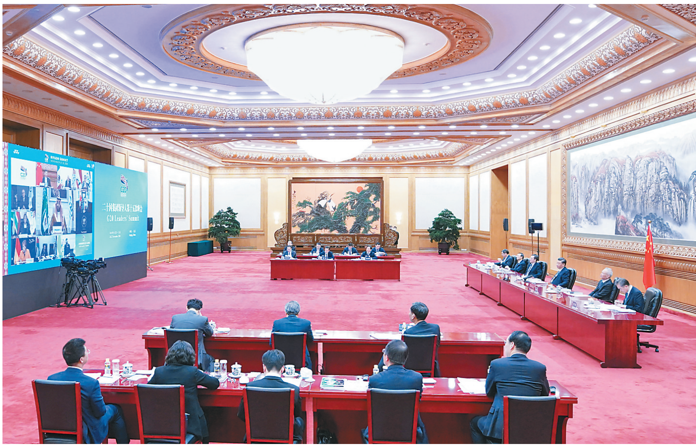
11月21日晚,国家主席习近平在北京以视频方式出席二十国集团领导人第十五次峰会第一阶段会议并发表重要讲话。