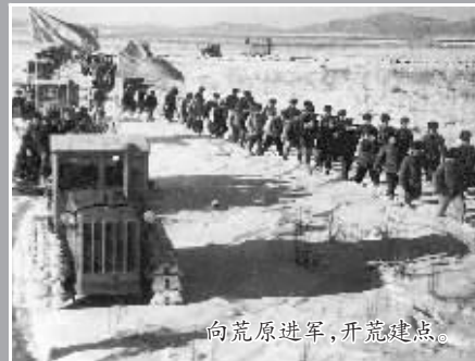
向荒原进军,开荒过坎。