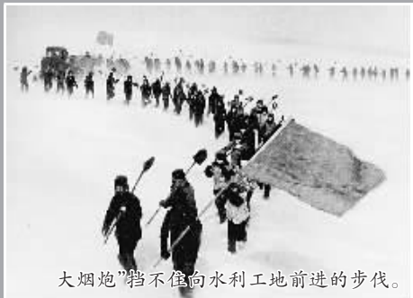
大烟炮”挡不住水利工地前进的步伐。