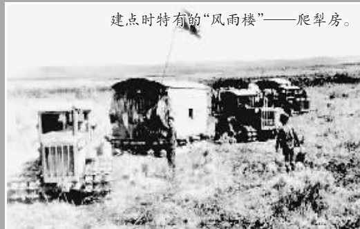
建点时特有的“风雨楼”——爬犁房。