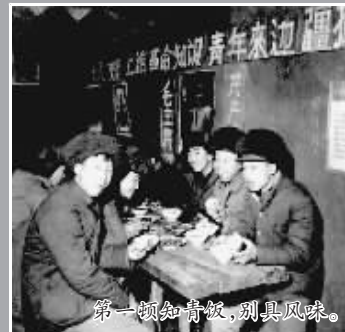
第一份知青报,别具风味。

那是一个波澜壮阔的年代,那是一个激情燃烧的岁月。自上世纪五十年代起,全国1740万城市青年参与了轰轰烈烈的上山下乡运动。他们战天斗地、无私奉献,用火热的青春书写了一部知青精神和北大荒精神的壮丽史诗。