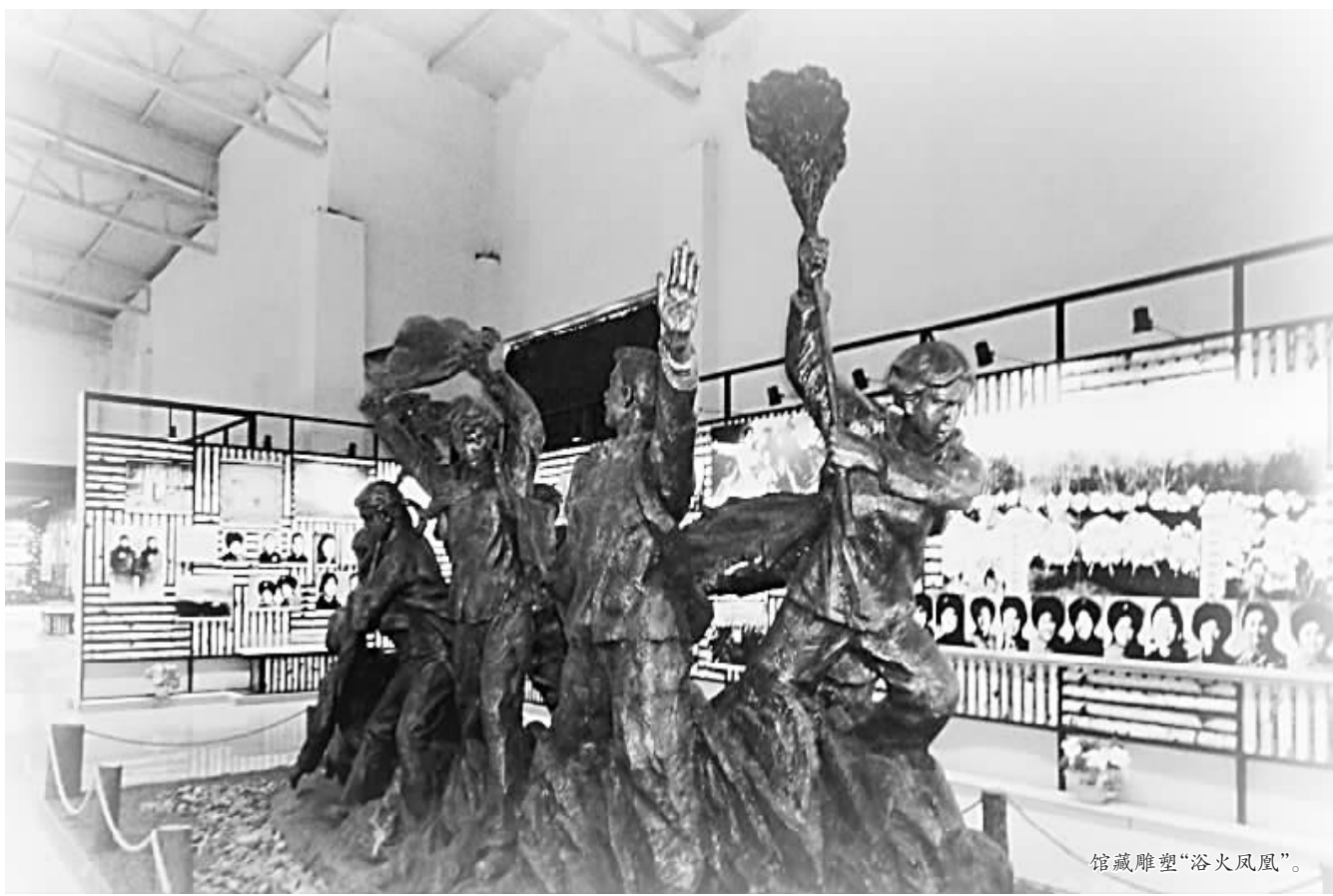
馆藏雕塑“浴火凤凰”。

全馆展出的内容充分体现了全国知识青年上山下乡的历史背景,他们为祖国和人民作出的历史贡献,以及知青中涌现出来的先进人物和英雄人物。