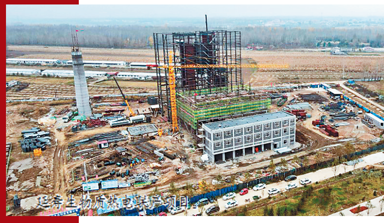
延寿生物降解塑料产业园项目。