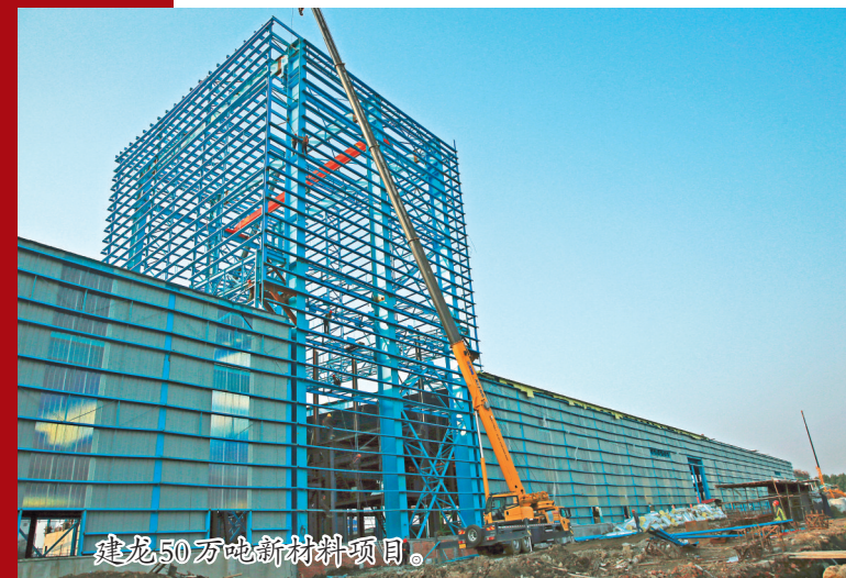
建龙50万吨新材料项目。