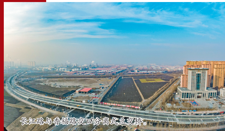
长江路与香福路交口分离式立交桥。

据悉,下一步,哈市将锁定“四率”抓冲刺,聚焦投资完成率低于90%的省市重点项目,逐个细化分解,做好跟踪调度。同时,做好投资人统,确保年内发生的投资尽早体现、颗粒归仓。着眼“十四五”规划,超前谋划抓储备,围绕基础设施补短板、公共服务补强提升政策窗口期,紧盯数字经济、新基建、5G等新兴产业,谋划储备一批利当下、管长远、打基础、扩规模的重大项目,确保项目接续滚动,有序建设,形成项目等资金等政策的积极态势。