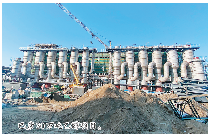
巴彦30万吨乙醇项目。

高质量产业项目全程“领跑”,百大项目宝能国际经贸科技园、深圳(哈尔滨)产业园科创总部等24个项目提前超额完成年度投资计划,绿地国博城、机场二通道等8个项目当年完成投资超10亿元。