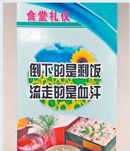
学校食堂的墙壁上,张贴着拒绝浪费的海报。