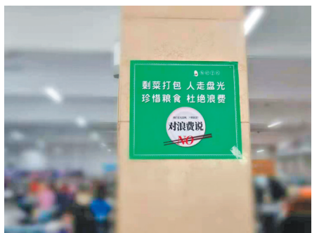
哈尔滨市某高校食堂里,宣传海报随处可见。