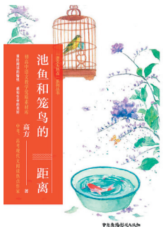
2020-11 中国广播影视出版社 高方 《池鱼和笼鸟的距离》