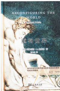
2020-10 商务印书馆 [美]玛格丽特·奥斯勒 《重構世界》

《池鱼和笼鸟的距离》像是一杯唇齿留香的茶，须得细细品味，才能体会被揉进生活里的柔情，而字里行间漫出来的真切情思，都穿过纸张落在心头。