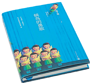
2013-5 人民文学出版社 迟子建 《候鸟的勇敢》

今年，在长篇小说《烟火漫卷》广受好评的同时，迟子建的中短篇小说也收获了两个重要奖项。10月13日，第六届郁达夫小说奖在杭州揭晓，迟子建《候鸟的勇敢》获中篇小说奖。12月6日，第五届林斤澜短篇小说奖颁奖典礼在温州举行，冯骥才、迟子建获“杰出短篇小说作家奖”。主办方在给迟子建的颁奖词中写道：“以地域文化为基点，以底层生存为焦点，努力营造短篇小说的诗意美学，使迟子建具有了清晰俊朗的辨识度，更使她具有了卓尔不群的重要性。”