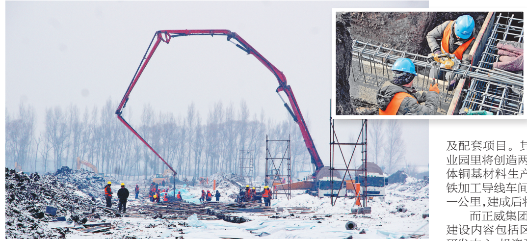
正威哈尔滨新一代材料技术产业园世界单体最大的生产车间建设现场。

“我们这个冬天要一直施工到明年1月末，这样抢抓工期，才能保证按节点推进项目建设。”正威集团黑龙江项目工程