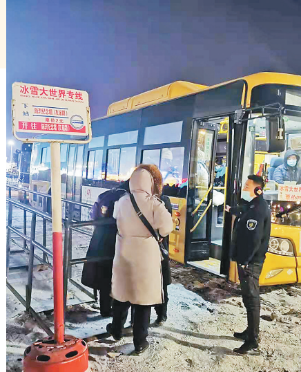
游客乘坐冰雪大世界公交专线。

与此同时,全国顶级雪雕比赛——第二十七届全国雪雕比赛正在园区内展开激烈角逐。在园区水阁云天的“艺术+空间”附近,来自国内的17支队伍、50余名雪雕高手正在比拼雕刻技艺。25日,他们将完成17件风格各异、创意独特的精美雪雕作品,为本届哈尔滨太阳岛雪博会再添佳作。