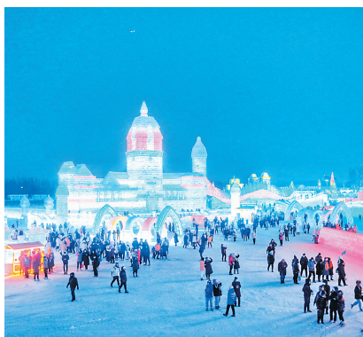
冰雪奇观吸引游客纷至沓来。

服务很贴心。雪博会期间,游客可享受太阳广场免费停车服务,还可凭门票免费参与打滑梯、打雪圈等雪上游乐项目。在游客中心,景区为游客免费提供棉服、轮椅及免费手机充电等服务。同时还提供特色的购物氛围、旅游商品,以及良好的就餐环境和丰富、健康、卫生的简餐、快餐食品。