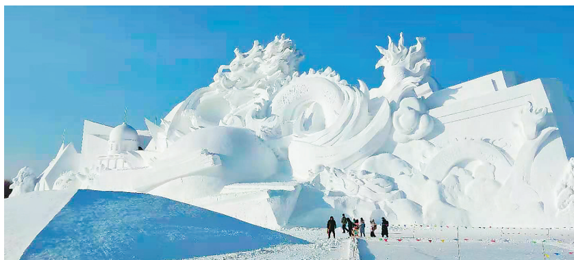
雪雕《华夏神龙》。 宋运军 本报记者 刘艳摄