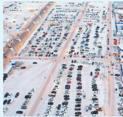
15时,冰雪大世界刚刚开园,停车场内几乎爆满。

在服务上,园区设有商服8处,全部引进肯德基、必胜客等在全国有50家以上连锁店的优质品牌。园区还设立了自营超市,销售食品、饮料、简餐等大众消费品,用以满足不同人群的消费需求。全新打造的4200平方米的售票大厅,大大提升了入园效率。