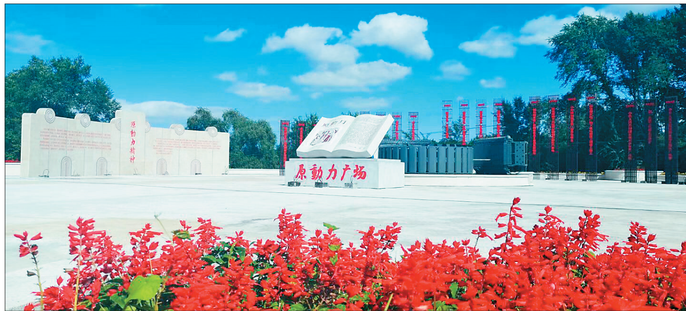
国网黑龙江省电力有限公司镜泊湖发电厂的原动力广场。

透过影视作品看时代变迁，跟着影视作品到哈尔滨旅游，看着那些老电影的片段，当影片中主题音乐响起的时候，好多人记忆的闸门瞬间就被打开了。这些珍贵的影视画面不禁让人唏嘘时光的匆匆流逝。