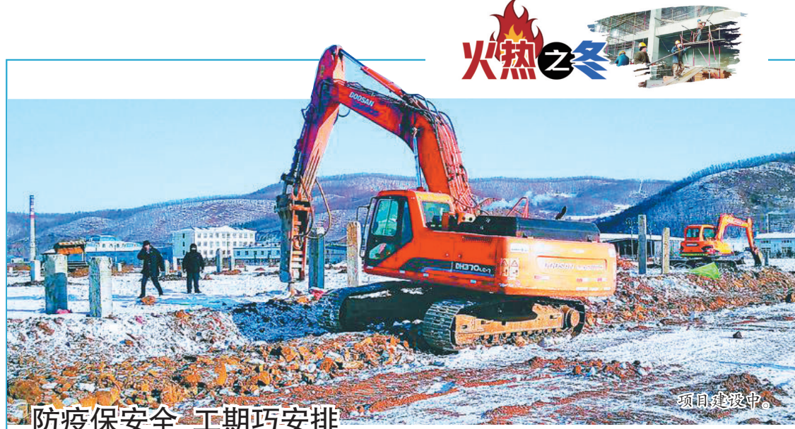
防疫保安全 工期巧安排

张庆伟强调,要更好推进“双一流”建设,建设一流学科,培养一流人才,打造一流师资,与“一带一路”沿线国家开展科技合作,联合省内高校共同推进“双一流”建设,打造名扬世界的理工强校、航天名校。要更好发挥科技力量支撑作用,坚持“四个面向”,瞄准前沿领域和国家发展需求,积极推进科技创新平台建设,创新科研管理体制机制,打好关键核心技术攻坚战。要更好融入振兴发展大局,发挥院士专家、领军人才和校友企业家作用,聚焦服务重大发展战略,在5G、人工智能、航空航天、新材料等领域加强科技研发,推动科研成果就地转化,自觉全面融入新发展格局。要更好推进高校党的建设,突出抓好政治建设,压实管党治党责任,加强干部队伍建设,持之以恒推进正风肃纪,培育良好校风学风,营造优良政治生态。省直有关部门要继续关心和支持哈工大发展建设,在校园环境改善、基础设施建设、创新平台建设、人才培养引进等方面提供更好的服务保障。 省直有关部门和哈尔滨工业大学负责同志参加会议。