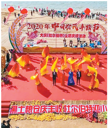
大庆粮食实现“二十二连丰”。