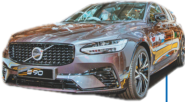
2020年9月4日,第20万辆沃尔沃汽车在大庆工厂整车下线,大庆沃尔沃已远销30多个国家和地区。

实现稳定脱贫,省级贫困县杜尔伯特县、国家级贫困县林甸县分别于2018年、2020年高质量摘帽,90个贫困村全部出列,全市贫困发生率清零。