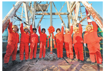
1205钻井队5年累计交井335口,进尺破45.3万米。