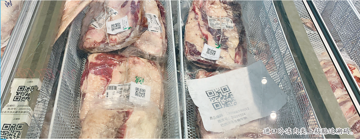
进口冷冻肉类上贴追溯码。

该家乐福超市目前有25种进口冷冻食品,商品信息全部录入到了系统内,贴上了电子追溯码,该展区的店员还会在旁边引导消费者使用该平台。