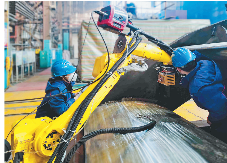
焊接现场。于玉坤 本报记者 李爱民摄

本报讯(贾瑞燕 于玉坤 记者李爱民)近日,哈电集团哈尔滨电机厂有限责任公司(简称哈电机)成功攻克机器人窄间隙气保焊生产应用难题,首次实现发电设备大型关键部件机器人焊接。 此次通过应用先进、高效、智能的机器人窄间隙气保焊技术,哈电机成功完成大型混流泵环固定导叶与环板焊接。经检验,焊缝UT(超声检测)探伤一次合格。相比常规焊接方式,单个焊口焊材消耗量下降76%,焊接周期减少50%。这是哈电机成功攻克有色金属自动堆焊、轴瓦巴氏合金全自动生产后,在智能制造领域实现的又一重大关键胜利。