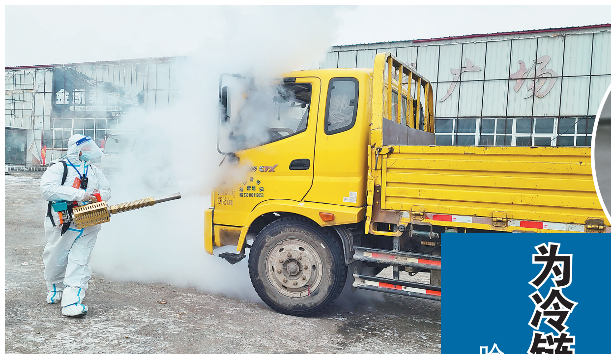
工作人员为运输车辆消毒。

香坊大街街道通过居民微信群、驻街单位微信群和辖区小门店微信群等三类微信群,最大限度地将在辖区内的各类人群纳入微信群进行管理。关于疫情防控的工作内容及通过微信群进行部署和反馈。对于辖区内无法掌握智能手机的老年群体,该街道“一对一”地安排了联络员,通过上门入户排查、电话排查等传统的“笨”办法,确保能够及时有效地了解这部分群体的状况。 香坊区香坊大街街道用细密的网格织牢了社区疫情防控网,扎实有效地落实了省市指挥部当前疫情防控工作“外防输出,内防扩散”的要求,为精准管控疫情传播风险发挥了积极作用。