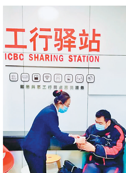
“工行驿站”为户外劳动者提供暖心服务。

本报讯(王勇)新年伊始,寒潮来袭。工商银行黑龙江省分行依托500余家“工行驿站”为户外劳动者提供暖心服务,积极践行社会责任与行业担当,为这寒冷的冬日增添一抹温暖。 “工行驿站”以“城市因您而变得更加美好”为服务宗旨,为环卫工人、志愿者、快递员、外卖小哥、出租车司机、城管人员、交通警察等户外劳动者提供临时休息、饮水、手机充电、饭菜加热等服务,也为老人、儿童、残疾人、考生等需要特殊关爱的群体以及其他有需要的社会公众提供服务。同时,工商银行以驿站为载体,提供金融诈骗防范、消费者权益保护、远离非法集资等相关普惠金融安全资讯宣传材料,让户外劳动者在休息的同时掌握金融常识。 在每个“工行驿站”配备饮水机、应急药品、针线包、雨具、充电器、防寒用品等便民设施,为前来办理业务的客户送