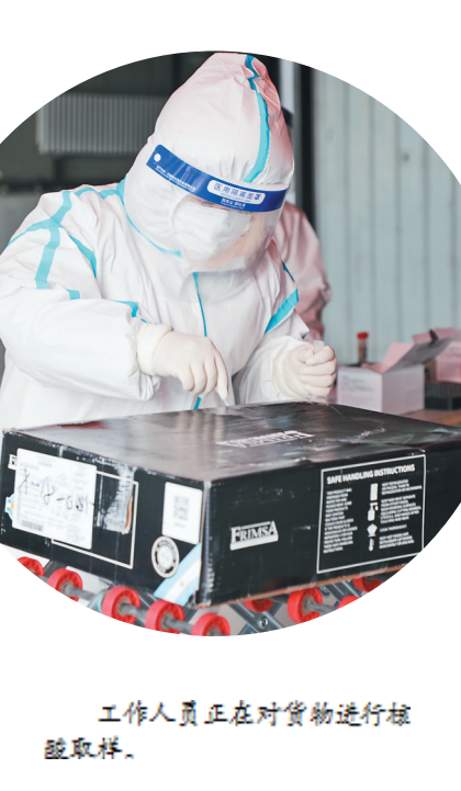
工作人员正在对货物进行核取样。

据了解,自《哈尔滨市生活垃圾分类管理办法》实施后,道里区执法局、道里区城管局和各街道办事处启动联动机制,即各街道办事处每天对辖区内居民小区、企业、九小商家等进行巡查,发现问题立即收集证据,提交给区城管局;道里区城管局再对问题进行甄别、筛选,将确实存在违规的商家、物业、企业等的有效证据交由道里区执法局,道里区执法局依据《哈尔滨市政府第6号文件》的规定下达《责令改正通知书》,在规定的期限内未改正的,将依法处以相应罚款。