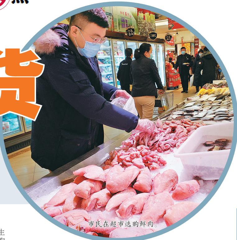
市民在超市选购鲜肉。

春节将至,疫情防控形势严峻。如何过一个安全、健康、快乐的春节,菜篮子供应是否充足,安全性如何保障,成为哈尔滨市市民关注的焦点。