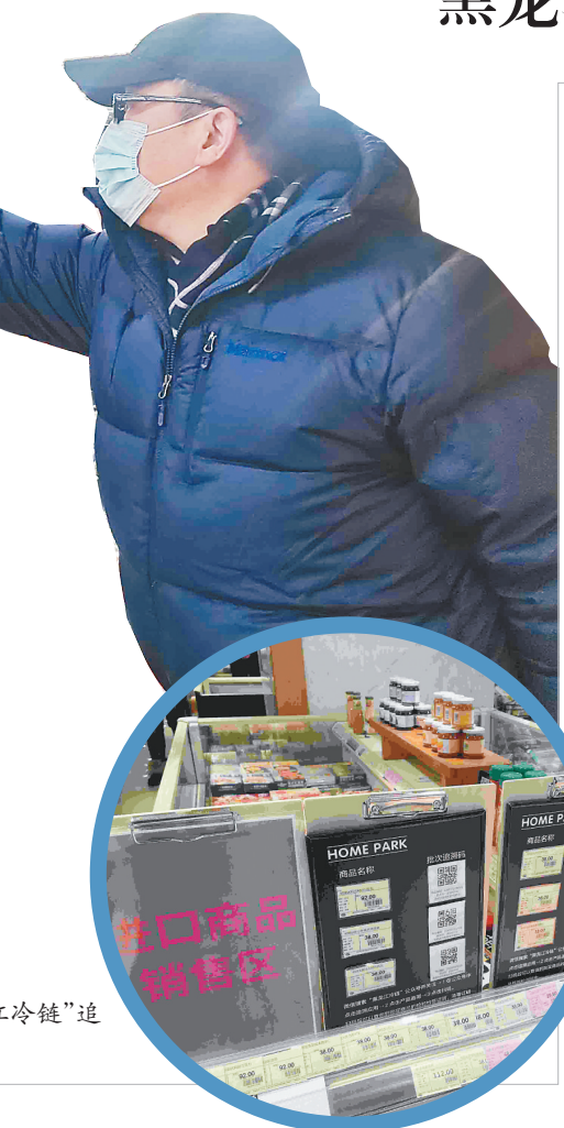
超市内的“黑龙江冷链”追溯码让百姓放心采购。

15日,“黑龙江冷链”追溯码正式投用,没有追溯码的进口冷链食品一律不得生产经营。当天,记者走访哈尔滨市多家超市看到,“黑龙江冷链”追溯码已成为“标配”。消费者用手机扫二维码就能实时查询到自己购买的进口冷链食品产地是哪里、是否有核酸证明等信息。