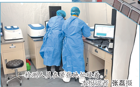
检测人员在紧张地忙碌着。