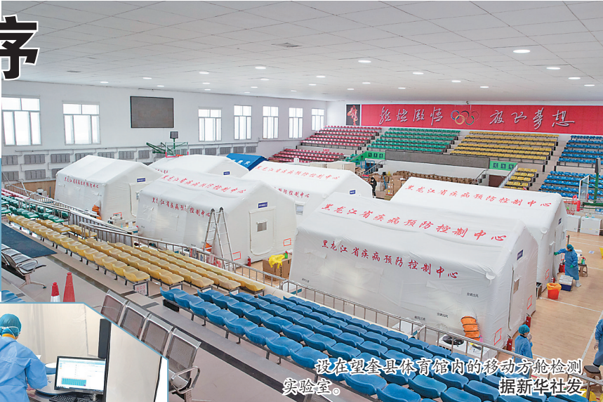
我在望奎县体育馆内的移动方舱检测实验室。