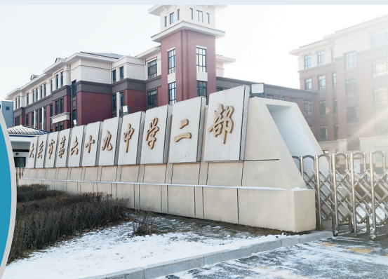
大庆69中学二部外景。

“我的孩子上初二了,没有做过一次化学实验。大庆69中学是名校,怎么能没有实验室,这不符合国家的教育要求,对孩子的学习影响很大。”近日,大庆市69中学多名学生家长致电本报,反映该校二部竟然没有实验室,孩子化学和物理成绩都不理想。11日,记者来到该校二部校区,了解到该校初三以下学生,竟真的没有上过一堂自己参与操作的实验课。