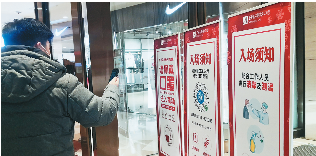
商场需要扫码测温进入。

记者了解到,1月13日除夕的火车票已经开始销售,12306的实时数据显示:从1月31日至2月11日期间,此前最热门的Z114次列车的硬卧、硬座车票均显示还有较多剩余,偶尔软卧一等卧车票只剩余个位数,与往年车票紧张的情况有明显不同。