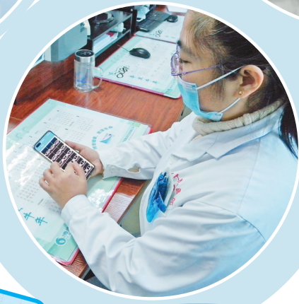
医生在手机端查看住院病人检查结果。