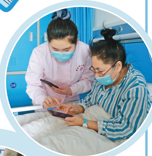
病人用手机缴纳各项诊疗费用。