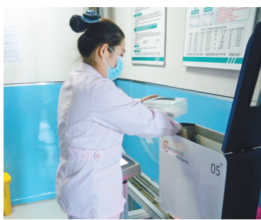
护士从物流小车内取药品。

也基于这套系统,实现了“智慧服务”。就诊患者可以通过医院官网、医院微信公众号和电话等多种形式进行预约挂号和办理电子就诊卡。检验检查报告等信息会被推送到患者手机上,如果报告中有危急值还会同时向医生和门诊部工作人员发送提醒消息。患者可以通过手机端办理入院手续,还可以使用医院APP、微信、支付宝等实现“一键付费”。