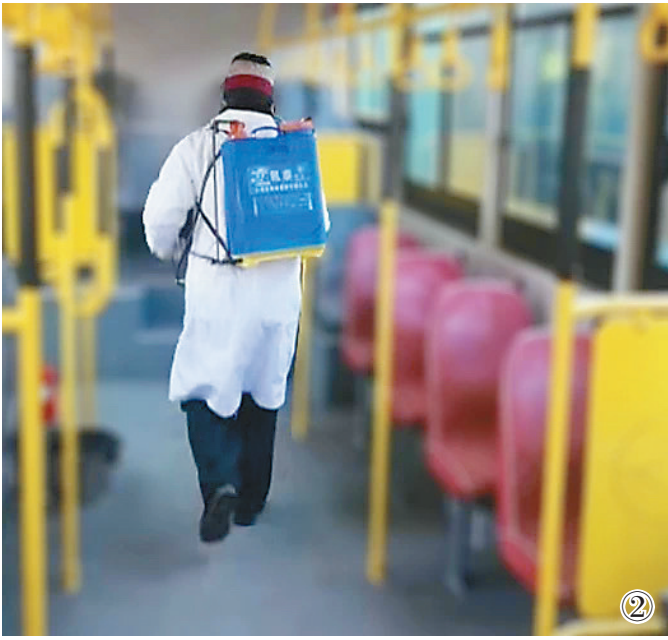
①②:工作人员对公交车辆进行消杀。

据了解,哈市要求全市256条公交线路,6414台运营车辆进行“每趟一消毒”“每趟一通风”;对公交停车场站等公共区域实施“不间断消毒”。为降低车辆满载率,防止出现人员聚集,哈市依托公交大数据平台,密切关注客流变化,通过开通区间车和大连快车等方式动态调整运营组织和调度方案。根据客流统计分析数据,逐条线路制定出行计划、运营周次计划、高峰发车间隔计划、应急备勤计划等,实现疫情期公众出行需求、车辆高效运营。