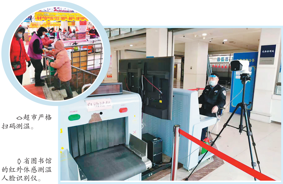
超市严格扫码测温。 省图书馆的红外体温测温人脸识别仪。

据了解,哈尔滨工大金涛科技股份有限公司污水源热泵系统流道式换热技术具有工艺流程简化、传热系数高、占地面积小的优点,可以保证原生污水工况下6个月内无需清洗维护。 黑龙江省桔乐农业科技发展有限公司生物制浆技术,基本实现了零排放、无污染,为消纳农作物秸秆提供了一条新路径,有效提高了农作物秸秆的综合利用价值,对推广实施绿色技术带来更多帮助。