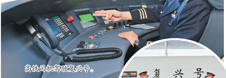
高铁司机驾驶复兴号。