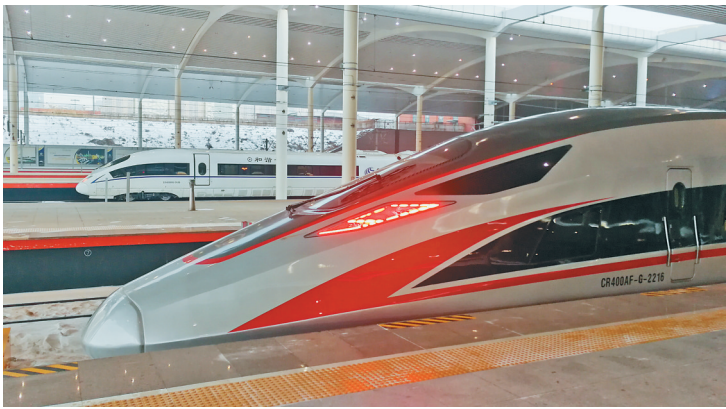
CR400AF-G型复兴号动车组抵达哈尔滨。

本报22日讯(记者徐佳倩 狄婕)22日14时56分,北京朝阳站始发的G913次列车抵达哈尔滨西站,京哈高铁开通首日,CR400BF-G型复兴号动车组顺利完成首趟正线运行。CR400AF-G型复兴号动车组于当日16时16分抵达哈尔滨,我省首次迎来新型复兴号高寒动车组列车,这也是复兴号