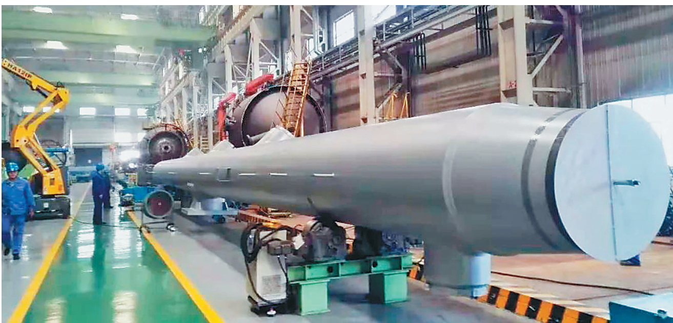
上图:哈电集团生产制造的“华龙一号”福清核电5号机组核心设备核岛主泵产成并发运到现场。 下图:哈电集团生产制造的“华龙一号”福清核电5号机组主蒸汽联箱产成并发运到现场。