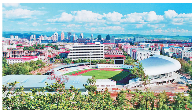
牡丹江北山体育场。