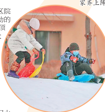
雪后玩爬犁,北方最常见的亲子游戏。

雪大世界,孩子们也很少去小区院里玩,为了增加孩子们户外活动的频率,我们和老人们一起利用顶楼的积雪,堆雪人,建滑梯,大家在一起其乐融融,感觉特别好。孩子和老人们的户外活动次数增加了,身体也能得到适当的锻炼。”