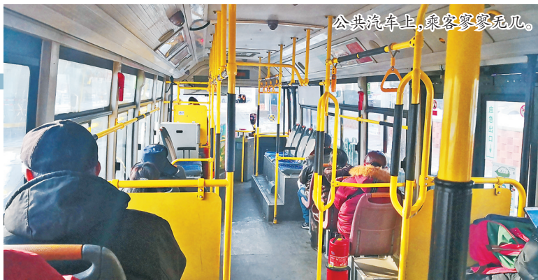
公共汽车上,乘客寥寥无几。

记者走访了解到,连日来,由于出行乘坐人数骤减,哈市超过1.5万辆出租车和接近6000辆公交车,都在调整各自的运营模式。与往日相比,各条主街和辅街略显空荡,早晚高峰也不再堵车问题。