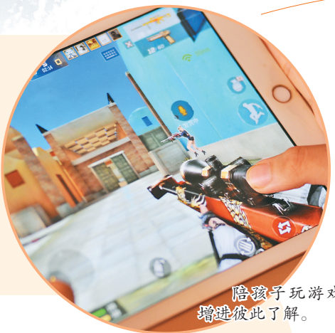
陪孩子玩游戏,增进彼此了解。

最近一段时间,省内多个地方开启了居家生活的模式,从早到晚在一起的父母、子女,从最初的甜蜜期开始演变成唠叨和躲唠叨的模式,甚至一家几代人各自捧着手机,除了吃饭几乎没有交流的场景也时有发生。也有很多家庭在居家这段时间,通过各种方式逐渐“破圈”:有的全家一起研究网上美食,学习热门舞蹈;有的发现父母身上的才艺,当起直播助手;还有的一起玩各种网红游戏……通过不同的娱乐方式,代沟被填平,一家人的心又融合在一起。