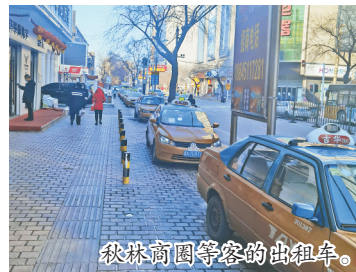
秋林商圈等客的出租车。

1月27日10时许,学府路中央红超市门前车行道边,有三十多辆出租车在排队等客。记者乘上一辆排在前面出租车,据司机师傅介绍,现在道上基本没有打车的市民,大家只好在医院、商超门前排队候客。“即便是这些场所,打车的也比平时少很多。”这位师傅说,这两天也有要打车的乘客,推门看到驾驶员位置没有设置隔离区,关门便走了。