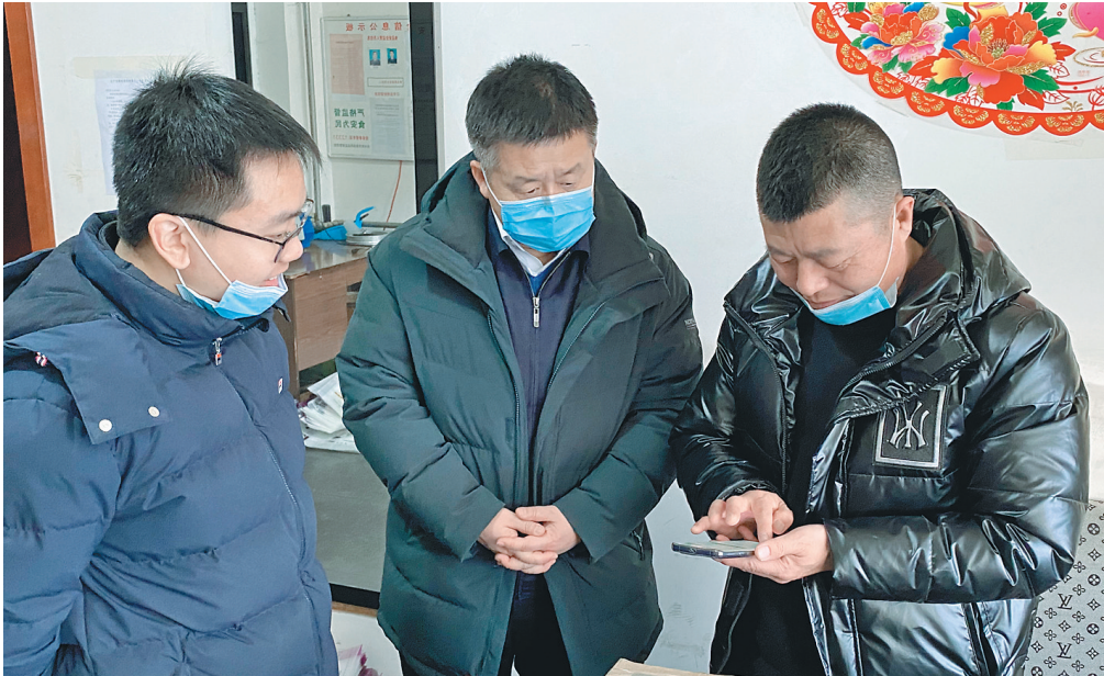
走访企业,帮解难题。