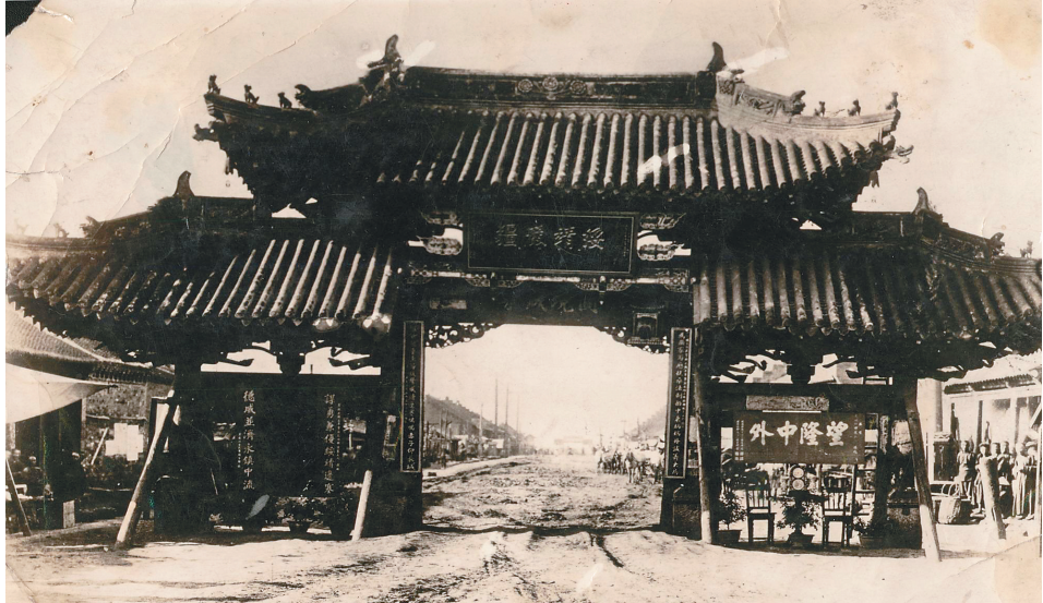
清末民初,呼兰老城南牌楼。