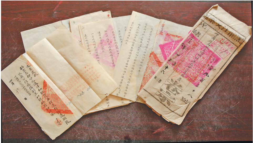
清代呼兰府《婚姻办法》档案文献局部。

正月十五元宵节,除了忌打碎器物、忌吵架骂人、忌请医生、忌遇丧葬之外,还忌新媳妇回娘家观灯和住宿。万一有事定要去娘家,也必须在天黑之前赶回婆家吃团圆饭。东北元宵节晚上要“送灯”,在农村家家用面做成碗状的灯,碗里倒上油,用线做捻儿,掌灯时在屋外的窗台上、大门墩上、仓房前一一点上。