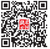
扫码关注 北国风副刊