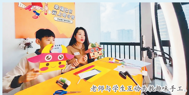
老师与学生互动共做趣味手工。

宅家也能参加冬令营?来自哈尔滨、齐齐哈尔、佳木斯、大庆、鹤岗等地的220余名小朋友,没想到自己居然“梦想成真”。