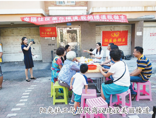
阳光社工与居民商议建设美丽楼道。

如今,走进39号楼单元楼道里,洁白的墙壁上,悬挂着各种书法、绘画作品,雅致而温馨的文化氛围,提升了居民的生活品质。