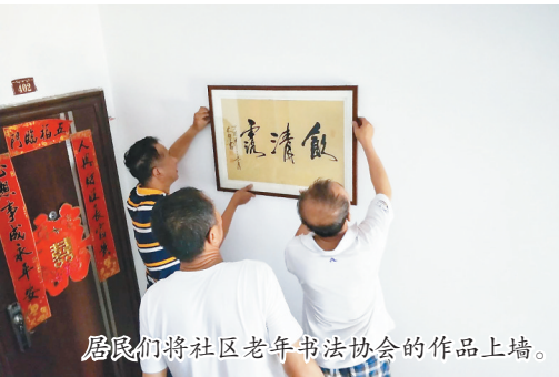
居民们将社区老年书法协会的作品上墙。