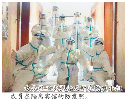
大众社工志愿者及所在防疫小组成员在隔离宾馆的防疫照。

疫情防控期间,您身边是不是活跃着很多志愿者?他们是通过什么方式和流程被招募的呢?