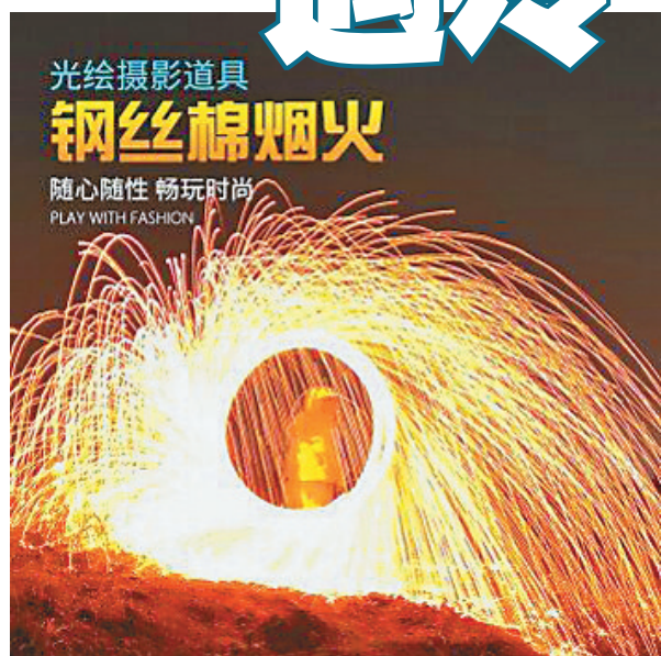
网上宣传的“钢丝棉烟花”。