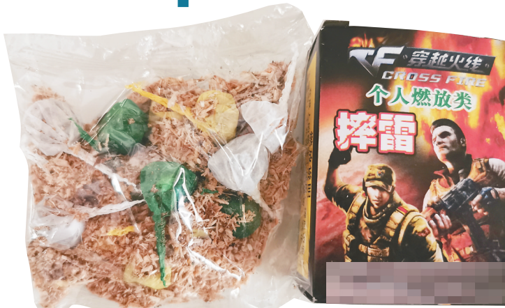
文具店销售的摔雷。

各级安委会及相关成员单位指导烟花爆竹批发企业严格落实流向管理制度,加强剩余产品返库核查,督促及时返库,分类储存,妥善保管,坚决杜绝非法烟花爆竹混入库房,避免烟花与爆竹混存混放;严禁将剩余产品储存在民宅或其他不符合要求的场所;对过期的烟花爆竹产品及时上缴公安部门进行销毁,确保剩余产品返库过程安全、有序。