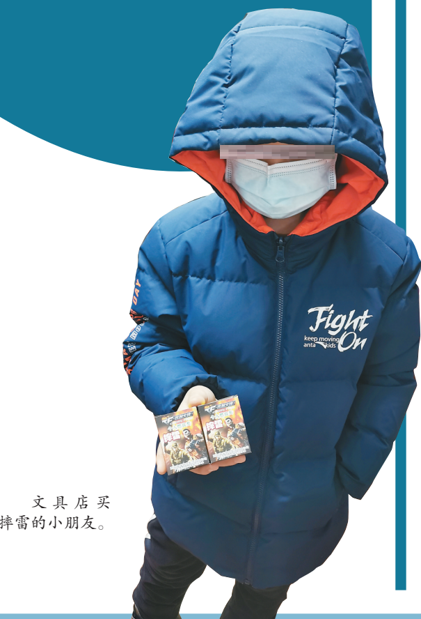
文具店买摔雷的小朋友。

“冷烟花”又称冷光烟花,是一种采用燃点较低的金属粉末,经过一定比例加工而成的冷光无烟焰火。