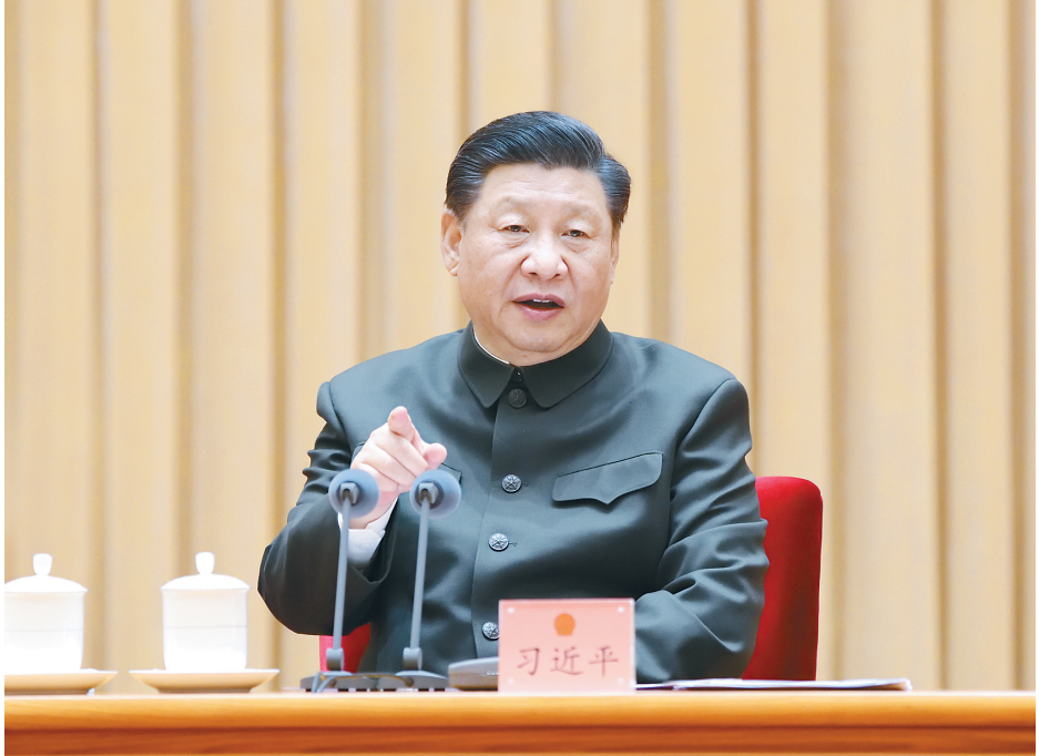
3月9日下午,中共中央总书记、国家主席、中央军委主席习近平出席十三届全国人大四次会议解放军和武警部队代表团全体会议并发表重要讲话。

新华社北京3月9日电(记者李宜良 梅世雄)中共中央总书记、国家主席、中央军委主席习近平9日下午在出席十三届全国人大四次会议解放军和武警部队代表团全体会议时强调,今年是中国共产党建党100周年,是“十四五”开局、全面建设社会主义现代化国家新征程开启之年,也是国防和军队现代化新“三步走”起步之年。全军要强化责任担当,弘扬实干精神,抓好常态化疫情防控,扎实做好各项工作,确保实现“十四五”良好开局,以优异成绩迎接建党100周年。