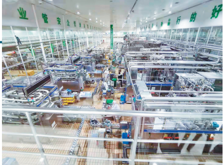
新年伊始蒙牛乳业生产一线红红火火。