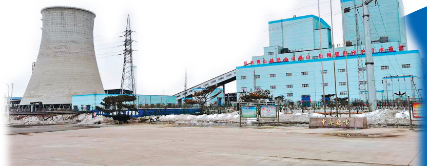
尚志中鑫热生物物质热电联产项目投产。

开局“十四五”，奋进“第一春”。近日，在哈尔滨市举行的招商引资项目云视频集中签约仪式上，尚志市8个重点产业项目重磅落地，总签约额达105.35亿元，签约额及签约数量均位于哈尔滨9县(市)之首。 新年“第一签”迎来开门红，也吹响了项目建设“集结号”。踏着春天的脚步，尚志市抢抓先机，一批续建项目提前开工，新落地项目前期审批逐步展开，释放重点项目建设牵引带动作用，确保“十四五”开好局、起好步。