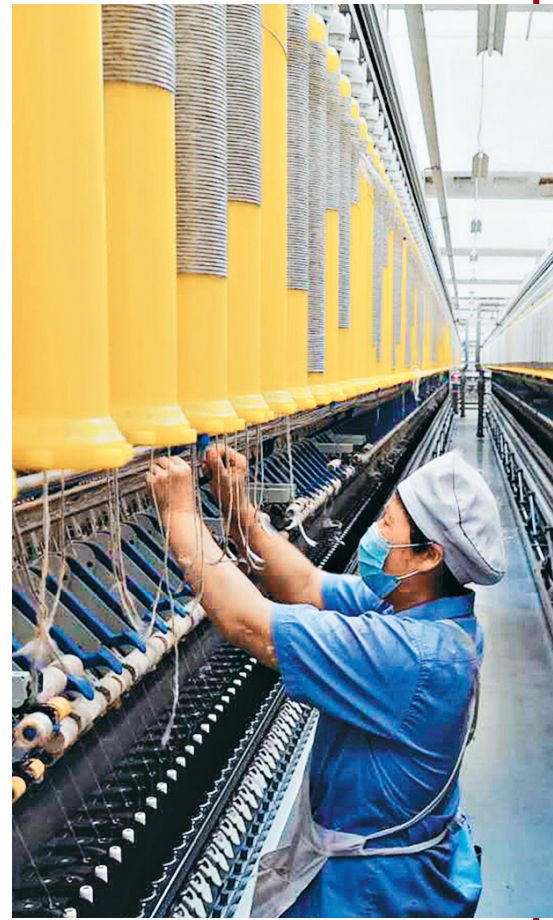
获得“黄金32条”奖励的黑龙江圆宝纺织股份有限公司提前复工。

布局文旅康养产业，深入挖掘城市资源禀赋和文化内涵，推进实施中国抗联历史文化红色旅游、中国书法文化旅游小镇、元宝村红色爱国主义教育基地、大星朝鲜族民俗田园综合体、鱼池乡新农村旅游开发等7个文化旅游项目。