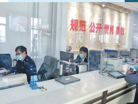
政务服务大厅综合窗口。