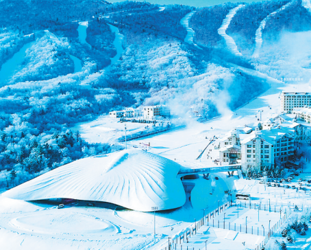
“亚布力论坛”永久会址项目竣工投用。