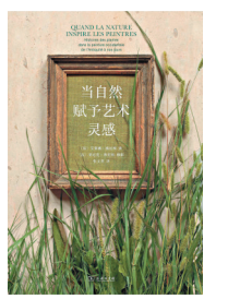
《当自然赋予艺术灵感》 艾莱娜·穆尼埃 亚尼克·弗里埃 商务印书馆 / 2020-11

巴扎克曾说：“如果没有咖啡，我就无法工作和生活。”... 本书被誉为咖啡全球发展史的经典之作... 德国作家海因里希·爱德华·雅各布在书中以出人意料的优雅文字... 详尽叙述了咖啡从进入人类社会到形成全球产业的历史过程... 他独树一帜地将咖啡作为历史中倔强的英雄、浪漫的主角... 充满情感地回顾了它经历的自然环境与社会变迁... 咖啡在全球的传播与发展... 以及经济与文化价值都在书中得到了生动的展现... 毋庸置疑... 本书是了解咖啡文化和咖啡发展世界史的必读专著。