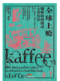
《全球上瘾 咖啡如何搅动人类历史》 海因里希·爱德华·雅各布 广东人民出版社 / 2019-1

米兰·昆德拉是当今最具影响力的作家之一... 影响力和作家色彩... 对于潜心文学创作... 刻意回避公众... 遮掩个人历史... 昆德拉有着各种矛盾的理解与评说... 对他的小说... 也有着各种理论性的解读... 传记作家布里埃的这部传记... 将昆德拉个人的艺术、文学、政治与精神历程置于大写的历史中加以考察... 同时借助与昆德拉有着直接交往的作家、翻译家、评论家提供的一些公开的和迄今尚未发表的资料与谈话内容... 深入探寻昆德拉的写作人生... 为读者展现了一个鲜活与完整的米兰·昆德拉。