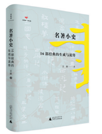
《名著小史》 王族 广西师大出版社 | 诗译者 2020-6