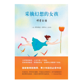
《采摘幻想的女孩》 阎选 文治图书 | 花城出版社

她们具体的妆束多有变动... 脸畔鬓发被整齐地梳起并虚虚撑宽... 发髻结在额顶呈低垂之状... 应是当时流行的“倭堕髻”... 妆面柔美... 眼角淡淡晕开红粉... 大约是唐人记载中所谓的“桃花妆”... 额间脸畔又施以浓丽的花钿与斜红... 开元时尚女性将织锦裁制、质地硬挺的背子融入外衣之下... 在两肩衬起宽阔的轮廓... 这时流行的长裙多用单色裙片拼缝... 裙片上端略加收褶... 穿着时裙带高束于胸间... 呈现裙身中部蓬起、裙裾自然收缩的状态。