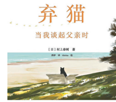
《弃猫 当我谈起父亲时》 村上春树 文治图书 | 花城出版社 2021-1

本书以两百余幅西方名画为中心... 带我们去探索令人难以置信的自然与艺术的关系史... 为我们梳理艺术家的趣味史和认识自然、摹真自然... 以及借由自然表达思想的艺术表现史... 绘画中的自然不仅讲述着人类自身的故事... 也揣摩着人类的认识自然之旅... 是人类与自然多层次关系的体现。