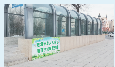
破损的外墙面被广告牌暂时遮挡。