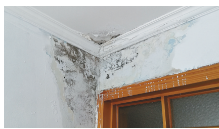
居民家屋内返潮漏水。