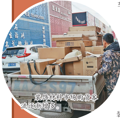
装饰材料市场购货客流逐渐增多。