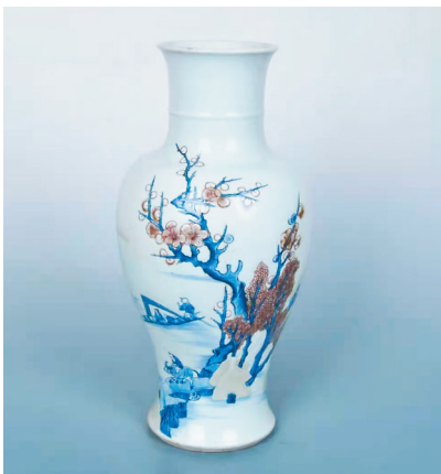
清朝盛世康熙、雍正、乾隆三代,当时政治稳定,经济繁荣,社会生产力提高。日益庞大的国内瓷器消费市场,

场,三代帝王对瓷器的喜爱和重视,督陶官郎廷极、唐英等对御窑厂的苦心经营,种种原因促进了瓷器生产进一步提升,瓷器生产在工艺技术和产量上都达到了历史高峰,进入了它的黄金时代。 釉里三色,创烧于清代康熙时期一种下彩品种,它也是康熙一朝特有的品种,它在青花釉里红的基础上增加了一种以铁为呈色剂的釉下彩——豆青色,有时也会加入白粉色,由于透明釉的保护作用,釉里三色相互映衬,永不褪色。 釉里三色山水纹观音尊,清康熙年制,口径13厘米,足径15厘米,高45.5厘米。此尊撇口,短束颈,颈中部凸起弦纹一道,丰肩,圆腹,腹下渐收,束胫,近足处外撇,圈足。此观音尊内施白釉,外壁绘山水景物图,水面视野宽阔,一望无际,水面上有一艘小船,一人划船,另有两人坐于船棚内,岸上一头牛在悠闲走着,牛背上驮着一人,岸边一棵高大树木从瓶身的腹部延伸到颈部,树干用青花,花叶用釉里红,山石用豆青色。纹饰从岸边往后延伸进深山,远处崇山叠嶂,鸟儿在空中飞翔,近处亭榭、树木、山石、江水。整幅纹饰展现了一幅幽静美丽、意境悠远、韵味十足的中国山水画卷。 (黑龙江省博物馆 王晓艳)