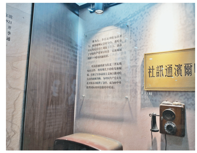
哈尔滨党史纪念馆展出有关“哈尔滨通讯社”内容。

100多年前,随着中东铁路的修建,红色的激流汇入黑色的土层,掀起汹涌壮阔的狂澜。1923年,“中共哈尔滨组”在哈尔滨成立,这是中国共产党成立后,在黑龙江乃至东北地区成立的第一个党组织。自此,星星之火在白山黑水间逐渐形成燎原之势。