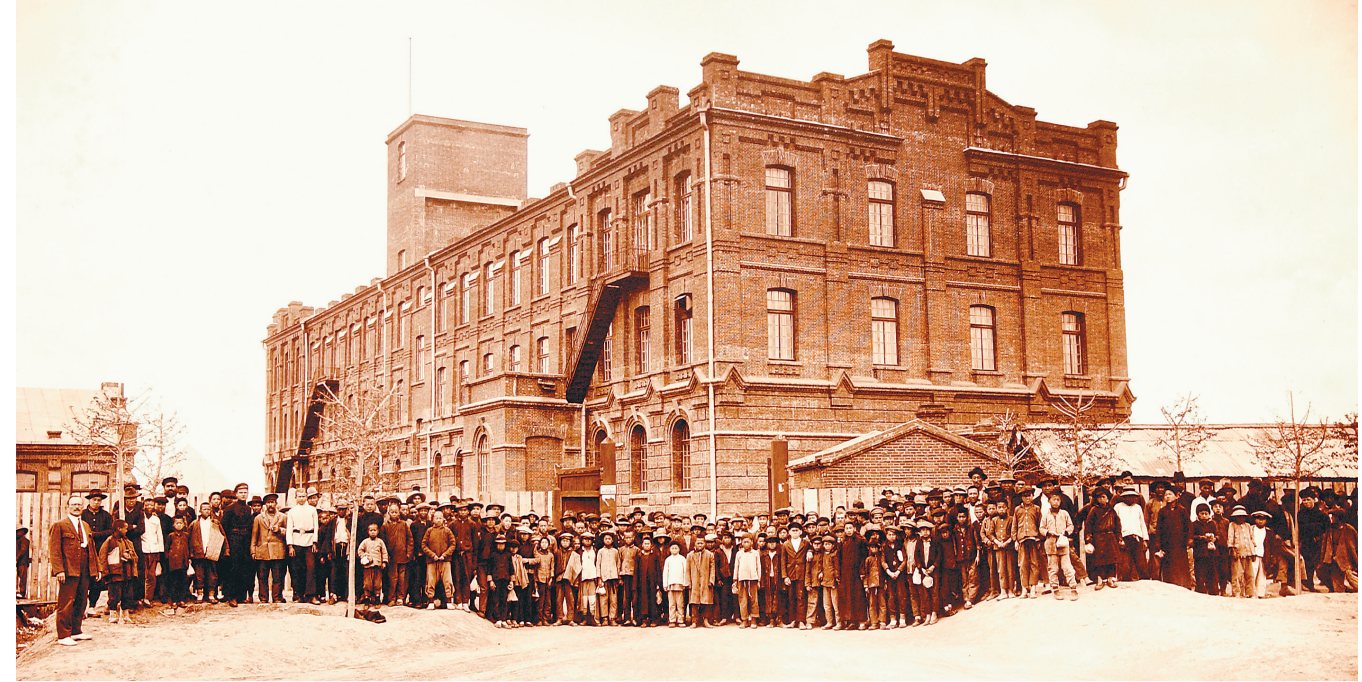
1922年,烟厂员工在工厂大楼前合影。

日前,工信部公布第四批国家工业遗产名单,哈尔滨卷烟厂旧址——老巴夺父子烟公司砖造纸烟工厂(“大黄楼”)成功入选,这也是我国烟草工业企业首次入选国家工业遗产。2021年,是“大黄楼”建成的第101个年头。新百年,新使命。近日笔者走进位于一曼街69号的这座老房子,聆听从烽火岁月中走来的余音回响。1903年的一天,年轻的退伍军官、莫斯科老巴夺烟厂厂长伊利亚·阿罗诺维奇·老巴夺在莫斯科火车站送别曾经的战友踏上征程时,偶遇了即将前往哈尔滨的随军护士季娜依达·米哈伊洛芙娜·施巴科夫斯卡娅。三个月后,老巴夺决定追随季娜依达所在的部队,从莫斯科前往哈尔滨。很快,两人在哈尔滨结婚定居,并将自己莫斯科的烟厂和哈尔滨中国大街(现中央大街)的卷烟作坊全部迁至埠头区宽街二十号(今道里区西十三道街巴拉斯旅店旧址处),创办哈尔滨葛万那老巴夺制造烟卷公司(即:葛万那烟庄),这便是哈尔滨卷烟厂的前身,并从此开创哈尔滨现代化制烟工业的先河。