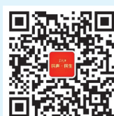
本版微信公众号 欢迎扫码关注