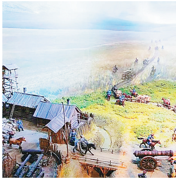
墨尔根古驿路博物馆中,古驿路再现。

驿站功能的提高和人口的增长使原有的驿站已不能满足需要,运行一百多年,驿站另选新址重建,其中二站、三站南迁2公里到了现址,而驿路不变仍在畅通。令人称奇的是,在这条久远的草道(或称驿路)两侧有诸多名胜古迹,国家级文物保护单位著名的辽金古城“八里城”,省级文物保护单位“望海屯”就雄踞在此条道路南侧凸起的松花江岸边,距今已800多年了。2000年三站镇宏泉村村民在古道旁发现了一具古代武士战死的尸体,身上中了七、八个由骨头制作的箭头,经县博物馆专家鉴定为辽金时代的箭头。此外,近百年来在这条驿路旁多次出现古坟墓,出土文物颇丰。这些充分说明围绕这条道路很早就有先人在此活动了。特别是自清朝在此建驿站,开通驿路以来,人口和村屯增速过快,民国初年,松花江开始修建堤防,这片辽阔的草原从此免受水患之害,沿途南北两侧建起了多座乡镇和几十座村屯,已经成为沿江政治、经济、文化中心区域。