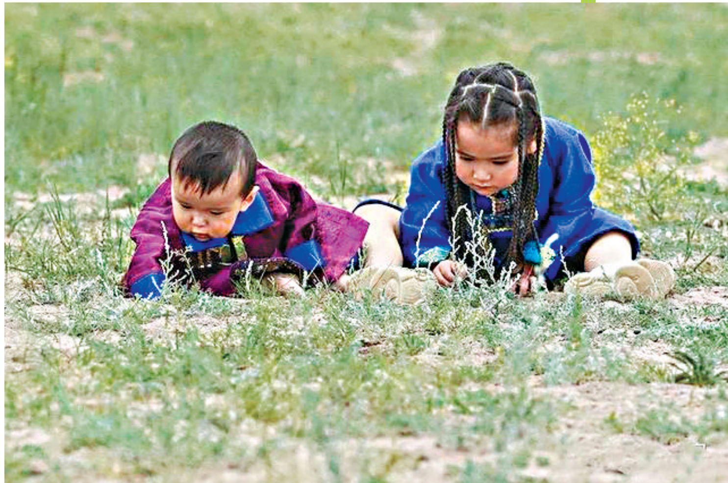
蒙古族儿童,草地捉虫。

责编:曹晖 (0451-84691037) 执编/版式:毕诗春 (0451-84659333) 美编:于海军 投稿邮箱: hljrbbsc@163.com