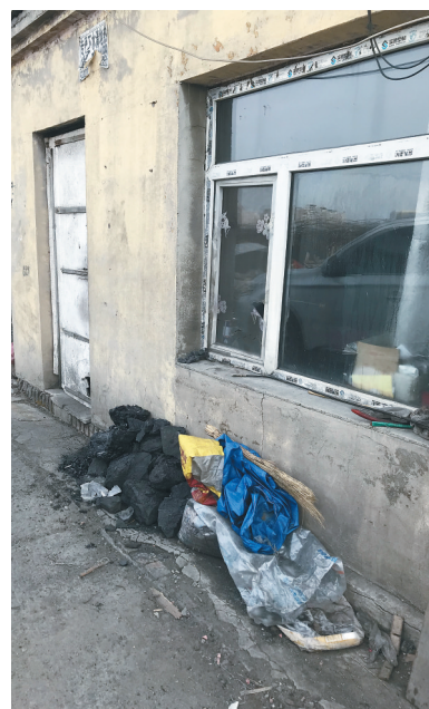
堆放在房前屋后用来取暖的木板等杂物。