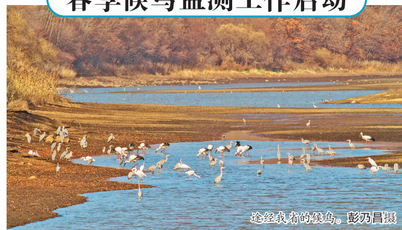
途经我省的候鸟。

本报讯(记者谭湘竹)春季是候鸟大规模迁徙和集群活动的季节,也是野生动物疫病防控关键时期和破坏野生动物资源高发期。记者从省林草局获悉,3月10日至5月15日,全省启动春季候鸟监测工作,为途经我省的候鸟保驾护航,主动预警可能发生的候鸟疫病传播。全省各级林草主管部门、各自然保护区管理机构加强对候鸟及其栖息地的巡护值守,及时发现和清除非法猎捕工具和设施,依法严厉打击和防范投毒、布设鸟网等乱捕滥猎候鸟等破坏野生动物及其栖息地的违法犯罪活动。同时,积极开展对野生鸟类野外救护工作,发现中毒、受伤的野生鸟类等野生动物,要向当地林草主管部门和有关单位报告。全面实行重点时期野生动物疫源疫病监测,加密监测巡查线路。