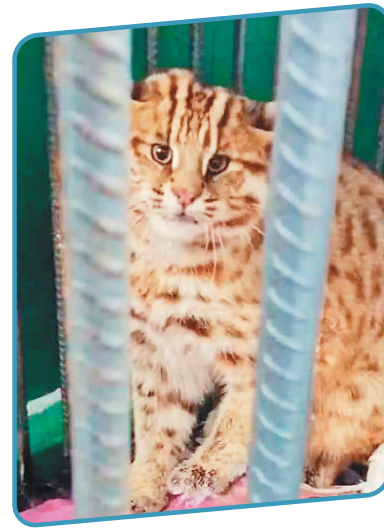
来村民家“做客”的豹猫。