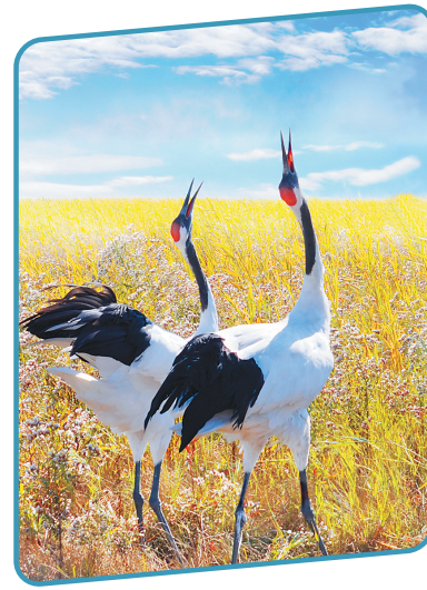
丹顶鹤,国家一级保护动物。