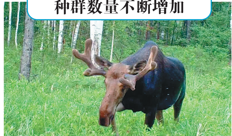
驼鹿,国家二级保护动物,栖息于中央站黑嘴松鸡国家级自然保护区。