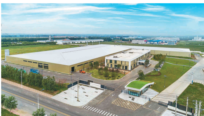
哈尔滨森鹰窗业股份有限公司的被动式工厂。

我省一位企业界观察人士表示,“招工难”将是企业长期面临的问题。如果说前些年企业自动化、智能化升级还是为了发展,如今自动化、智能化转型升级已经上升为能否生存下去的问题,这一紧迫感已经从招工上体现出来了。