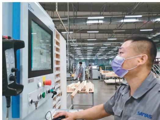
哈尔滨森鹰窗业股份有限公司员工操控设备。

不仅如此,为了打造工匠文化,森鹰还举办工匠大赛,评选不同等级的星级工匠,发掘工匠、培养工匠、激励工匠,凸显一线工人价值的同时,员工在争做星级工匠的同时,也为企业发展注入力量。