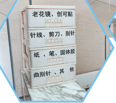
医院为老年患者提供的“暖心”服务。