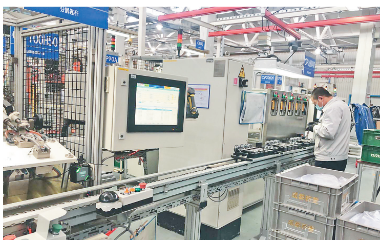
东安动力工人正在生产线上紧张忙碌着。

哈市工信系统提供工业项目全生命周期的跟踪服务,建立了市级工信部门抓行业项目和统筹指导各区、县(市)工信部门抓地域项目的双轨工作机制。建立三级包保责任制,即一级市级领导包保、二级市工信局包保、三级区县(市)政府包保,区县(市)工信系统建立相应的项目包保责任制。通过开辟“绿色通道”等方式,从项目谋划、开工建设、要素保障、投产等方面开展全方位的服务。