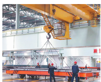
东轻员工正在吊运某合金厚板。