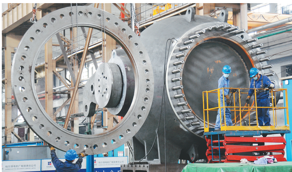
哈电电机生产现场。