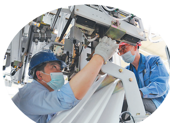
哈尔滨博实自动化生产现场。