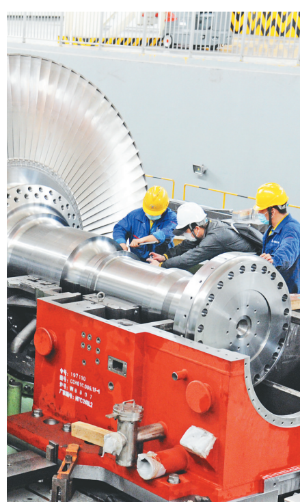
哈汽轮机生产现场。

推进现有搬迁企业的建设,重点围绕哈量集团、哈药总厂、哈轴等企业正在实施的搬迁改造工程,做好项目要素的协调保障工作,对于企业在搬迁中遇到的困难及时给予协调解决。针对腾挪出的产业空间,深度谋划现代产业园及高端产业园区,实现产业升级迭代;做好谋划搬迁企业的推动,围绕全市工业产业布局,对拟进行搬迁的航天科工哈尔滨风华公司、东安动力、建成集团等,帮助搬迁企业做好产业园区的对接和服务保障工作。