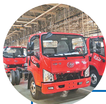
一汽哈尔滨轻型汽车有限公司。