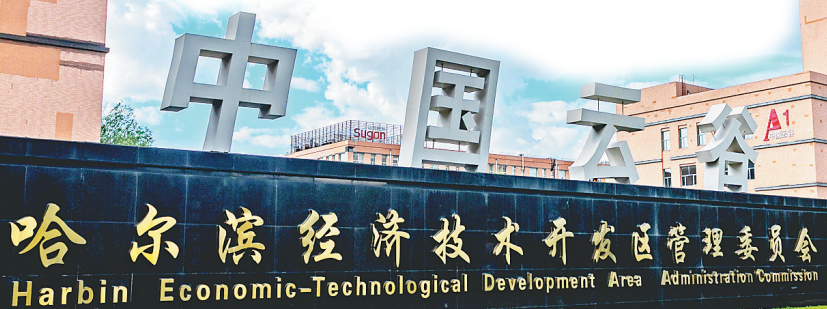
哈尔滨经济技术开发区管理委员会 Harbin Economic-Technological Development Area Administration Commission

在招商引资工作中,全市工信系统紧紧抓住国际国内双循环重要机遇,围绕制造业强市和5G基站建设、大数据中心、人工智能、工业互联网等新基建拓展契机,积极承接京津冀、长三角、粤港澳大湾区产业转移,引进一批能够打通产业链供应链堵点断点、支撑大规模、结构调整的大项目好项目,培育哈市高端产业生态圈。