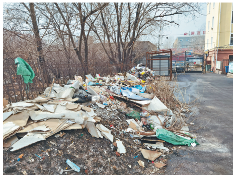
未清理的残雪堆上布满垃圾。

在道外正阳南小区,记者看到小区内的绿化带内,前几日的积雪还没有清走,上面又扔上垃圾。居民说,这里的积雪基本都是靠天气“清走”的,很少见到专人清理。