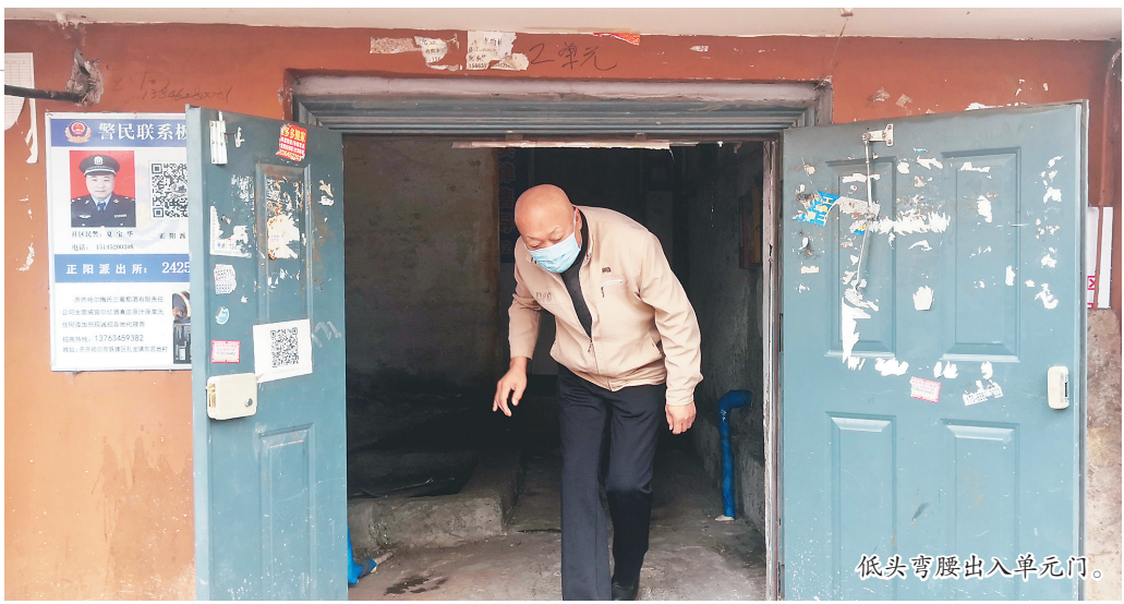
低头弯腰出入单元门。