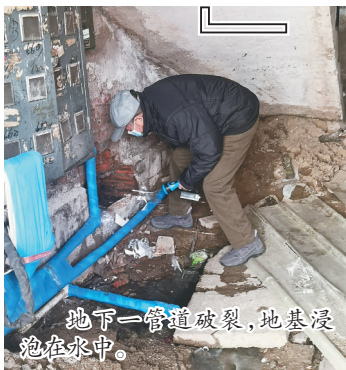
地下一管道破裂,地基浸泡在水中。

对于这种情况,记者采访了当地的相关部门,工作人员表示已经开始对楼体进行鉴定,并会根据鉴定结果做出进一步的判断和处理。