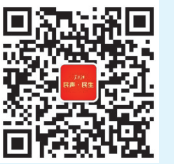
本版微信公众号 欢迎扫码关注