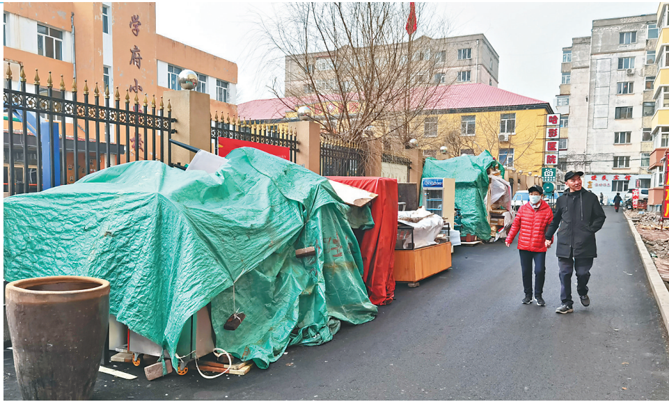
杂物占据了近一半小区内的消防通道。

记者在现场看到,街角的公厕指示牌与街道牌比邻而立,指示牌上除了公共卫生间的双语说明和指示箭头外,部分内容有疑似遮盖痕迹。按照箭头所指方向望去,不远处只有革新外贸服装城的人口和革新教堂。按照箭头方向走,一直走到教堂广场东侧尽头仍找不到公厕。附近居民介绍,记得此前革新教堂广场附近,似乎有过公厕,可能因为某些原因拆除了,但指示牌没有拆。也有居民反映说,革新教堂作为市中心的一个旅游观光景点,应在合适位置设立公厕。